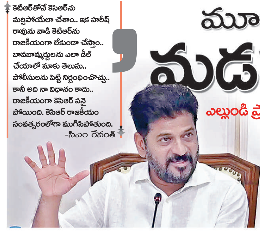
ప్రభావవర్తి ప్రధాన ప్రతినిధి, హైదరాబాద్, అక్టోబర్ 29: మూసీ పునరుజ్జీవ ప్రాజెక్టుపై ముందడుగు వేయడమే తప్ప... వెనక్కి తగ్గే ప్రసక్తి లేదని ముఖ్యమంత్రి రేవంత్ రెడ్డి స్పష్టం చేశారు. ఏదైనా నిర్ణయం తీసుకునే ముందే వెయ్యి సార్లు ఆలోచిస్తామని... తీసుకున్నాక వెనక్కి వెళ్లేది లేదన్నారు. మంగళవారం సచివాలయంలో ఆయన మీడియా ప్రతినిధులతో ఇన్ఫోర్మేషన్ మాట్లాడారు. నవం

వృద్ధుల ఆరోగ్య బీమాకు రూ.5 లక్షలు కొత్త పథకాన్ని ప్రారంభించిన ప్రధాని మోడీ 70 యేళ్లు పైబడిన వారికి వర్తింపు ఆయుష్మాన్ భారత్ ను ఢిల్లీ, బెంగాల్ వ్యతిరేకిస్తున్నాయంటూ విమర్శ న్యూఢిల్లీ, అక్టోబర్ 29: రాజకీయ ప్రయోజనాల కోసం ఆయుష్మాన్ భారత్ పోల్డర్ బీమా పథకాన్ని ఢిల్లీ, పశ్చిమబెంగాల్ రాష్ట్రాలు అమలు చేయడంలేదని ప్రధాని మంత్రి నరేంద్రమోడీ ఆక్షేపణ వ్యక్తం చేశారు. ఆయుష్మాన్ భారత్ సీమ్ను 70 ఏళ్ల వయోపరిమితికి తాము విస్తరించినప్పటికీ ఉచిత బీమా అందనందుకు ఢిల్లీ, బెంగాల్ వయోవృద్ధులకు ప్రధాని