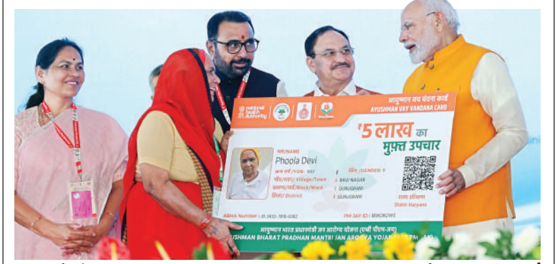
న్యూఢిల్లీలో మంగళవారం అర్జులకు ఆయుష్మాన్ భారత్ కార్డులను అందజేస్తున్న ప్రధాని మోడీ

Published from Hyderabad, Vijayawada, Visakhapatnam, Rajahmundry, Guntur, Nizamabad, Ongole, Warangal, Tirupathi, Kadapa, Kurnool, Anantapur, Karimnagar, Mahabubnagar, Khammam, Nellore, Nalgonda, Tadepalligudem, Srikakulam 30-10-2024 బుధవారం సుపుది: 30 సంబంధం: 272 పేజీలు: 8+4 వెల: 6.50